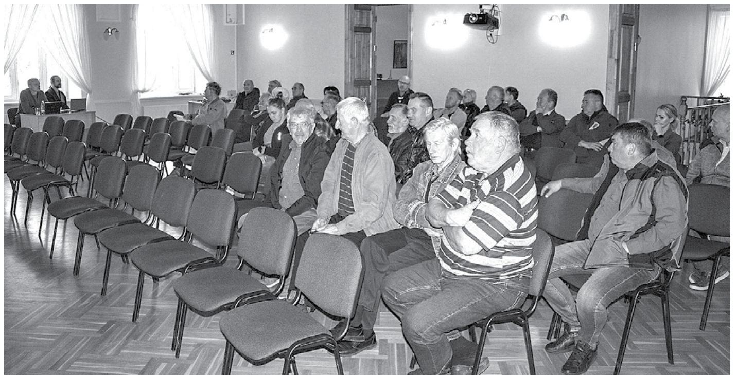
Iepazīties ar elektronisko uzskaites sistēmu Liepupes tautas namā bija sanākuši vietējie piekrastes pašpatēriņa zvejnieki

Vairs aiz kalniem nav 1. janvāris, kad piekrastes pašpatēriņa zvejniekus sagaida izmaiņas nozvejas datu reģistrēšanā. Līdz šim zvejas žurnālu varēja aizpildīt papīra formā un nodot Valsts vides dienestam, bet no nākamā gada nozveja būs jāreģistrē elektroniski. Šādas izmaiņas paredzētas 2020. gada 7. aprīlī veiktajos grozījumos Ministru kabineta 2007. gada 2. maija noteikumos Nr. 296 Noteikumi par rūpniecisko zveju teritoriālajos ūdeņos un ekonomiskās zonas ūdeņos . Grozījumi paredz, ka ar 2023. gada 1. janvāri piekrastes ūdeņu pašpatēriņa zvejniekiem nozvejas reģistrācija jāveic Latvijas zivsaimniecības integrētajā kontroles informācijas sistēmā (LZIKIS). Tās lietotāji ir gan zvejnieki, operatori (zivju produktu pirmie pircēji, zivju apstrādes uzņēmumi, transportētāji), gan Zemkopības ministrija (tās pārziņā ir šī sistēma), tāpat pašvaldības un kontroles iestādes (Valsts vides dienests, Pārtikas un veterinārais dienests, Valsts ieņēmumu dienests, Muitas pārvalde), kā arī pārtikas drošības, dzīvnieku veselības un vides zinātniskais institūts BIOR. Komercczvejnieki LZIKIS izmanto jau kopš 2021. gada 1. janvāra.