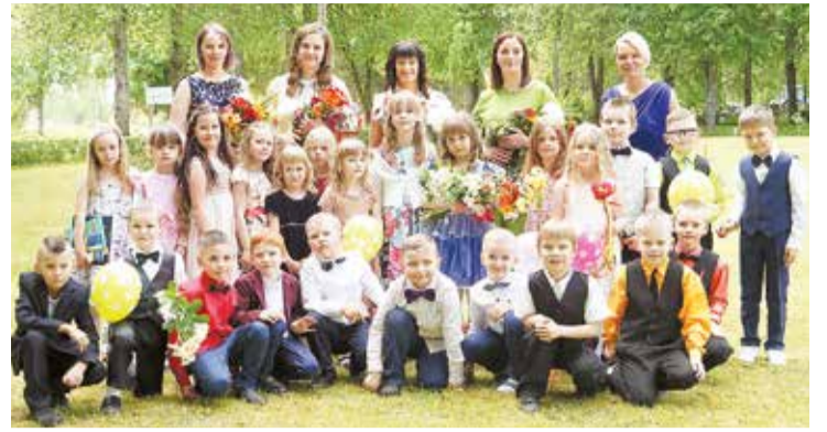
Izlaidums Alojās PII "Auseklītis" Vilzēnu struktūrvienības "Spārītes" grupā.

Šis gads ir pierādījums tam, ka ir iespējams apvienoties divām grupām – "Spārītēm" un "Bitītēm" – un kļūt par vienu lielu komandu, kas ir kā liela ģimene. Novēlam, lai bērniem bērnu-