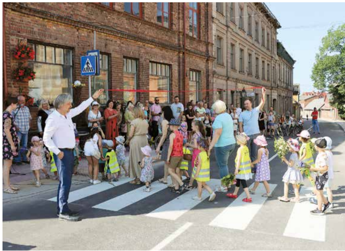
Pirmsskolas izglītības iestādes "Buračino" audzēkņi ir vieni no pirmajiem gājējiem atjaunotajā Jūras ielā.