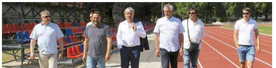
Darbi Zvejnieku parka stadiona sektoros pabeigti labi, tāds ir pašvaldības speciālistu un būvnieku secinājums.

16. jūnija pēcpusdienā Zvejnieku parkā notika projekta “Stadiona vieglatlētikas sektoru projektēšana, autoruzraudzība un izbūve Zvejnieku parkā, Salacgrīvā” noslēguma pasākums.