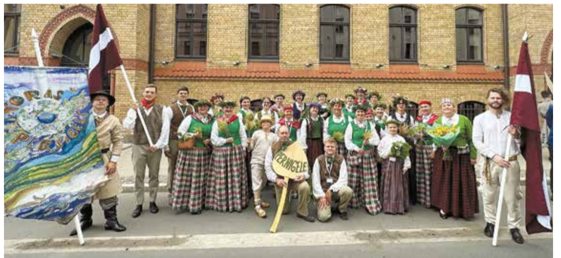
Koris “Pernigele” pēc svētku gājiena.