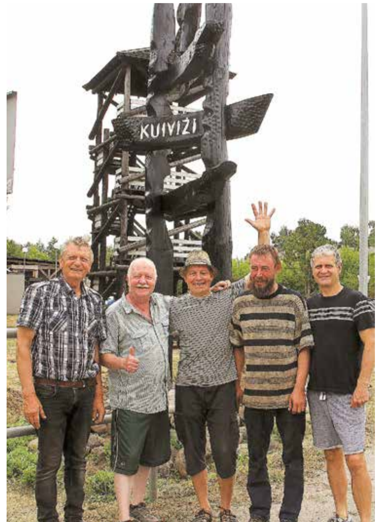
Atjaunotās Kuivižu identitātes zīmes uzstādītāju komanda.