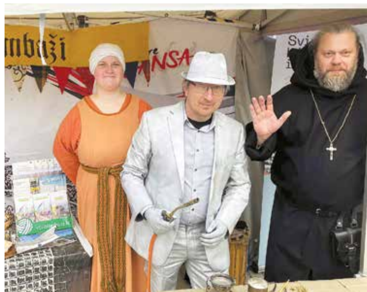
"LAUTAs" pārstāvji Hanzas dienās Vīlandē

Hanzas dienu apmeklētājus iepriecināja Improvizācijas leļļu teātra studija "Ilze", interesantās aktivitātes kopā ar Limbažu muzeju pārstāvjiem, kā arī gardumu degustācija no maiznīcas "Lielezers".