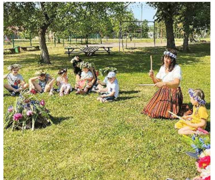
PII "Auseklītis" vasaras grupu bērni svin vasaras saulgriežus