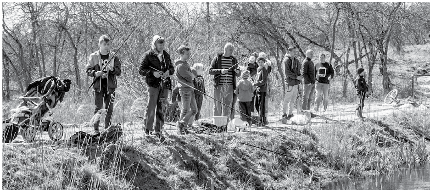
Tāda aina bija pie Ozolaines dīķa vienās no bērnu un jauniešu sacensībām