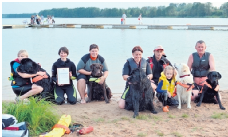
Lielezera ūdeņos varēja vērot suņu - cilvēku glābēju paraugdemonstrējumus