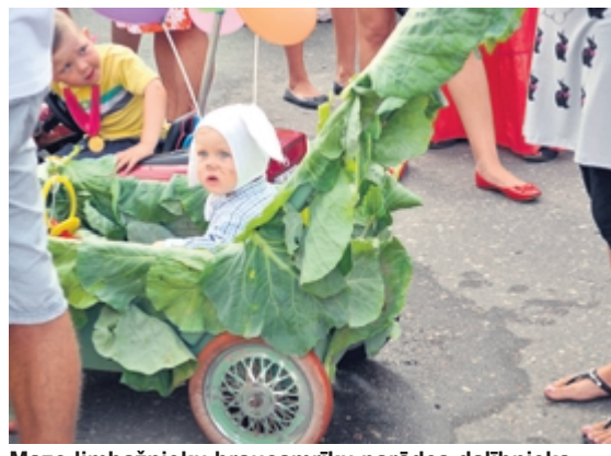
Mazo limbažnieku braucamrīku parādes dalībnieks - zakis kāpostlapu transportlīdzeklī