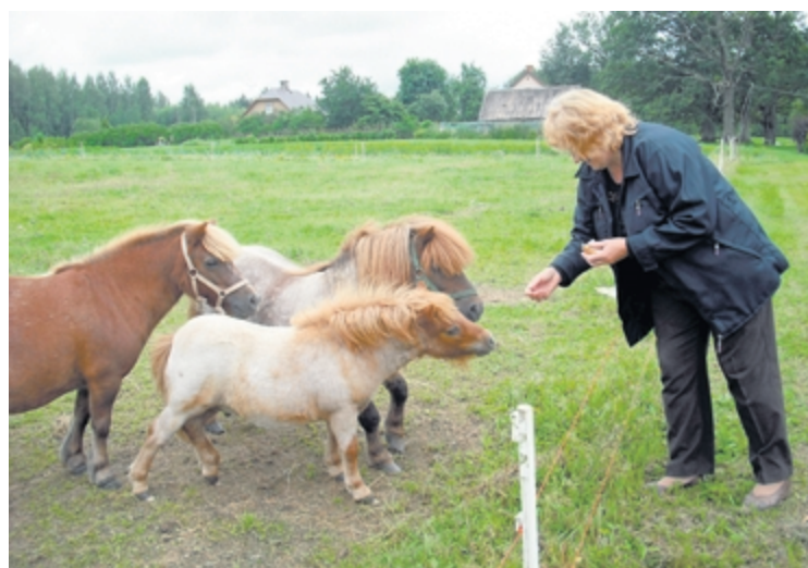
Pie ponijiem minizoo Bērzkalni