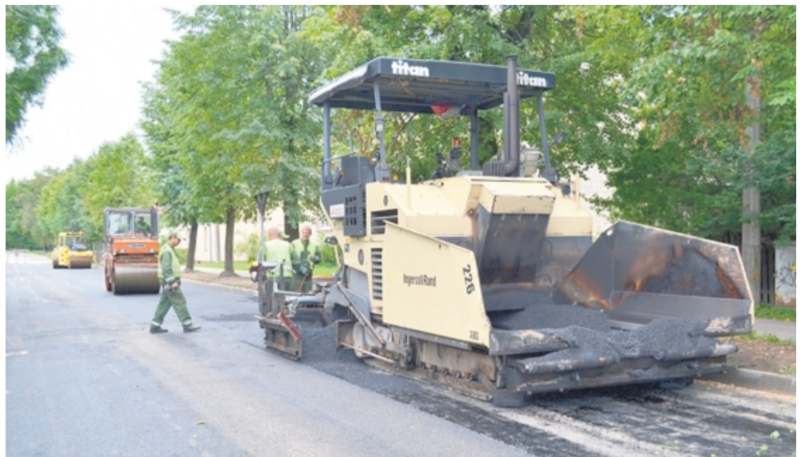
Rīgas ielas posmā no Jaunās līdz Sporta ielai uzlej asfaltu

Savukārt laukumā pie novada pašvaldības administratīvās ēkas demontētas betona plāksnes, sakārtota lietus ūdens kanalizācija, kā arī ierīkotas strūklakas darbības nodrošināšanai nepieciešamās komunikācijas. Jāatgādina, ka par strūklakas skulpturālo formu izvēlēts kamols, kas sasauca ar novada logo un Limbažu kā sudraba pilsētas tēlu, jo kamolu veidos no nerūsējoša tērauda caurulēm, kas rada spīdumu. Zem kamola atradīsies baseins, no kura caur kamola lokiem plūds 12 ūdens strūklas. Tās izvietos asimetriski un virzīs dažādos leņķos, apskalojot kamola skulptūru un veidojot izteiksmīgu vides dizaina objektu. Strūklu augstums periodiski mainīsies, maksimālā augstumā stiepjoties līdz 3,5 m. Dienakts