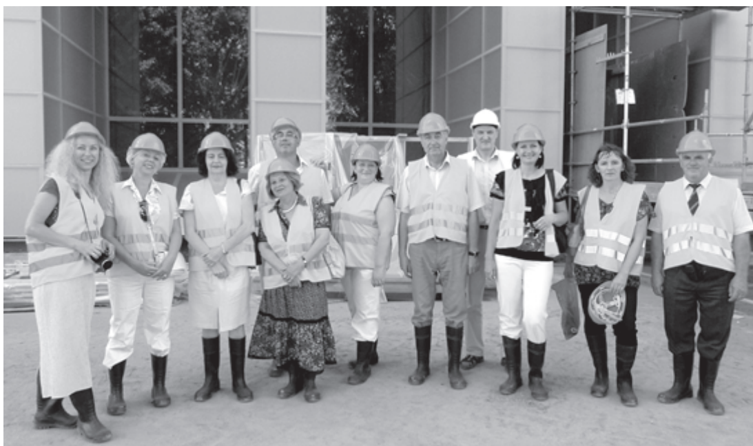
Limbažu un Pēterburgas bibliotekāri pie Latvijas Nacionālās bibliotēkas jaunceltnes

Bibliotekāri tika iepazīstināti ar LGB un Bērnu bibliotēku. Viesiem sevišķi patika Valmieras integrētā bibliotēka, kur īpaši domāts par lietotāju ērtībām mūsdienīgās telpās. Valmierā viesi piedalījās vakara pasākumā kopā ar starptautiskās riteņbraukšanas ne-konferences Velobraucieni par