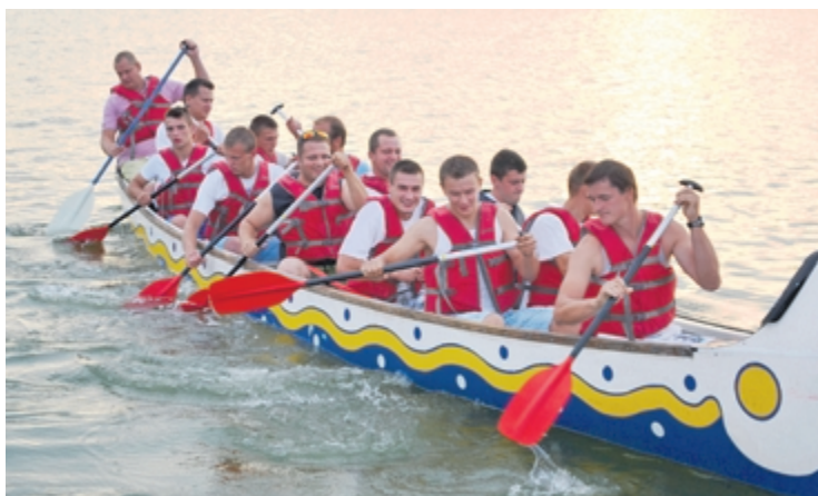
Neiztrūkstoša pilsētas svētku sastāvdaļa ir iestāžu un uzņēmumu sacensības vikingu laivu braucienos