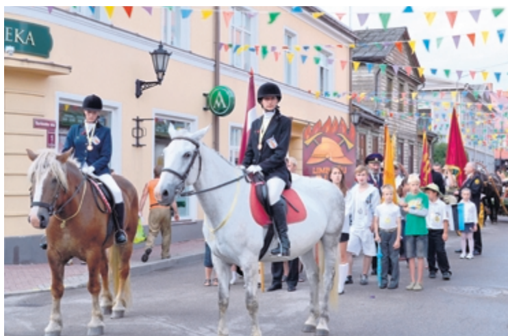
Svētku gājienā zirgu mugurās, pajūgos un kājām kuplā skaitā devās Limbažu Brīvprātīgo ugunsdzēsēju biedrība