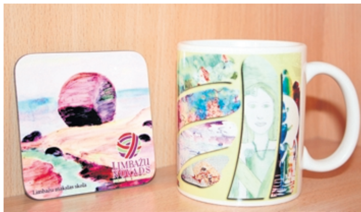
Krūzīte un paliktņis ar Limbažu mākslas skolas audzēkņu darbu fragmentiem

Kalendāru var iegādāties Limbažu novada Tūrisma informācijas centrā (TIC). Trīs laimīgie suvenīra pircēji iegūs pārsteiguma balvas, tāpēc uz pirkuma čeka