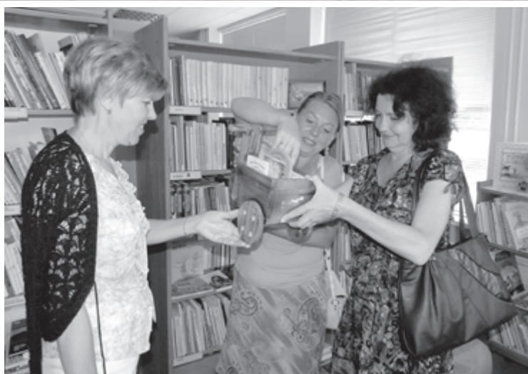
Viļķenes pagasta bibliotēkas bērnu stūrītī

bibliotēkām daudzu valstu dalībniekiem. Kolēģiem bija interesanti aplūkot jaunās Gaismas pils celtniecību Rīgā, apmeklējot būvlaukumu. Viņi ciemojās arī Rīgas centrālajā bibliotēkā, kur izvērsās diskusija par bibliotēku nākotni un bibliotekāru lomu informācijas sabiedrībā.