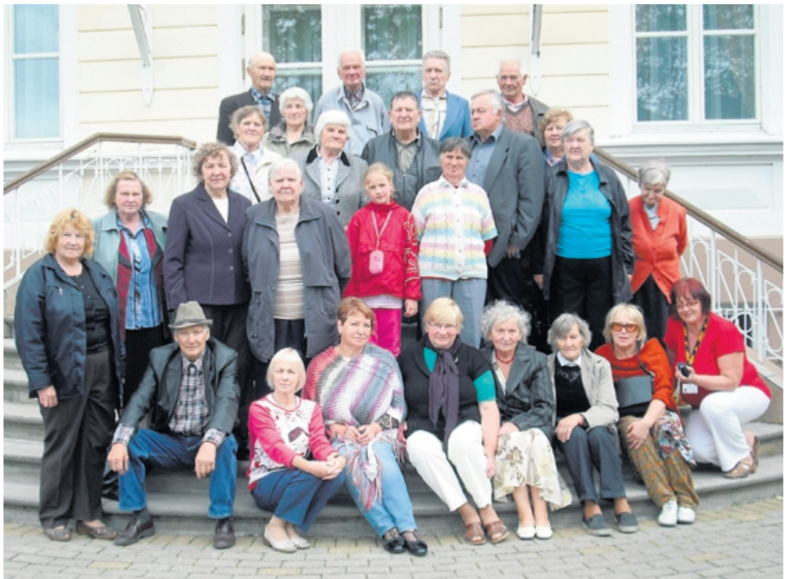
Pāles seniori uz Igates pils kāpnēm