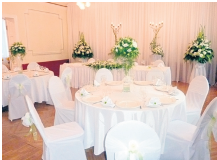
Uzvarētājas Lindas Rubezes veidotā kompozīcija Zaļās kāzas Igates pils gaumē