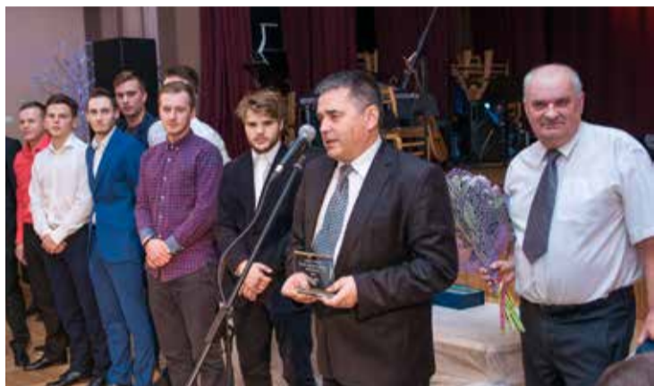
► Turpinājums no 1. lpp.