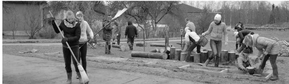
5.B klases skolēni kopā ar vecākiem veido Sajūtu taku un spēļu laukumu.