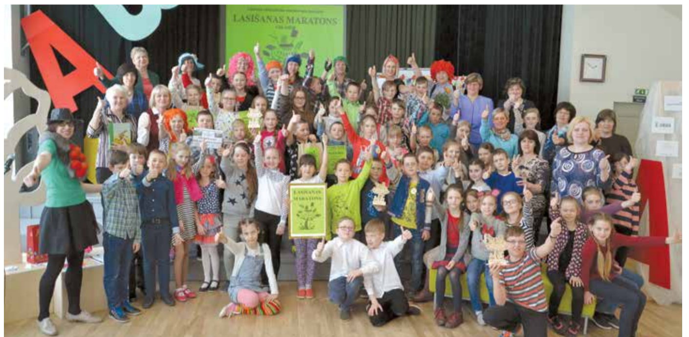
3.klašu „Lasīšanas maratona dalībnieki”.