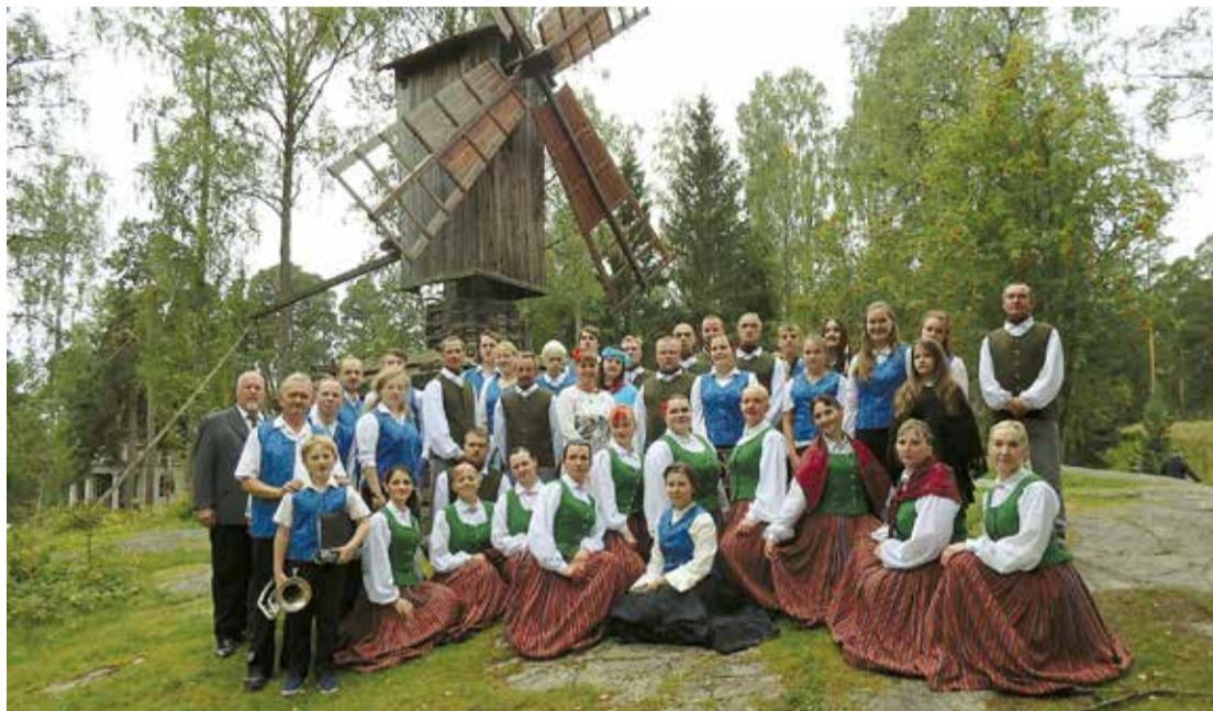
Vidējās paaudzes deju kolektīvs „Nāburgi” un pūtēju orķestris „Pociems”.

Kultūras namam ir izveidojušās stipras un noturīgas tradīcijas, piemēram, Lāčplēša dienā kultūras nama pakalnītē iededzam svecītes spēkāzīmes veidolā, un tad vienmēr ir sarūpēts svētku koncerts, kopā svinam Latvijas valsts dzimšanas dienu. Kultūras nama sezona regulāri tiek iesākta ar rudens ziedu izstādi,