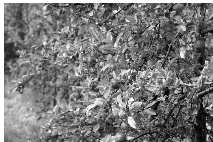
„Reķi” ir viena no veiksmīgākajām saimniecībām pagastā. Tas tāpēc, ka saimnieki sekojoši savai sirds balsij – pēc darba, pēc zemes, pēc veiksmes.