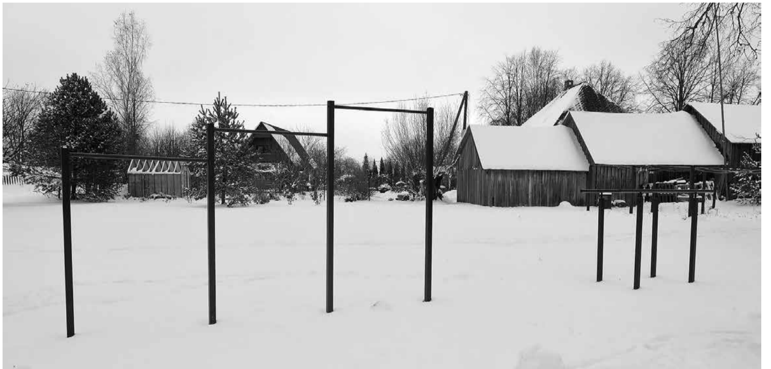
Āra vingrošanas stienis pie Sporta ielas 5, Pociemā, Katvaru pagastā.

Biedrība “Pūtēju orķestris Lemisele” organizēja konkursu jauniešiem izpildītājiem, radot 12 jaunas instrumentācijas pūtēju orķestrim ar solisti, kā arī organizēja laureātu un noslēguma koncertus Limbažu kultūras namā, šim mērķim saņemot līdzfinansējumu 357 EUR apmērā.