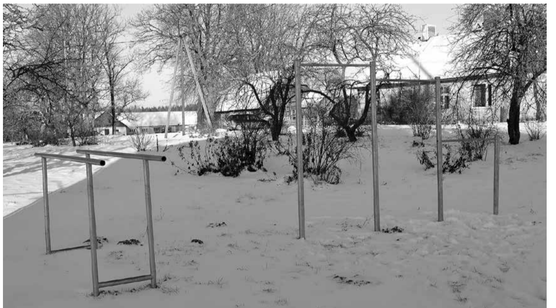
Pievilksnās stienis pie daudzdzīvokļu mājām Intēs.

Biedrība “Katvaru ezers” veica Katvaru ezera piekrastes lab-