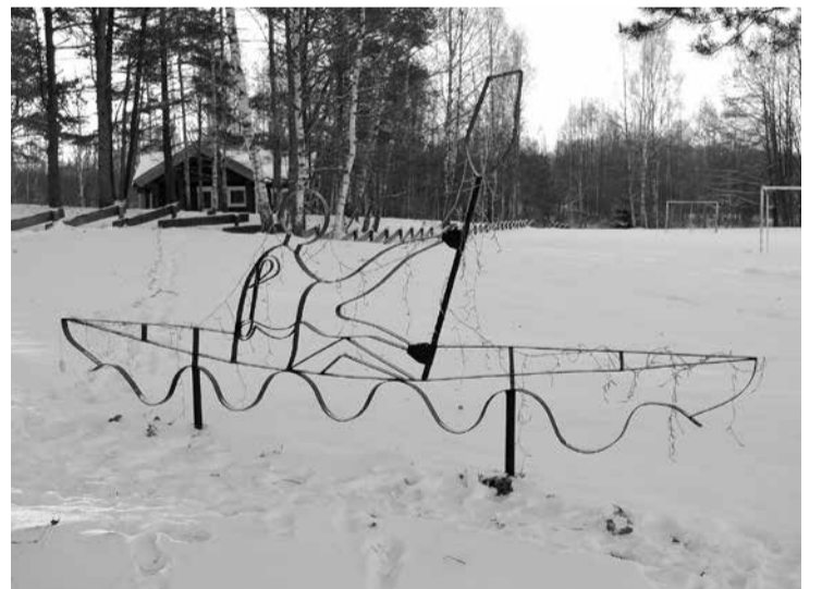
Metālkaluma un ziedu vides objekts “Airētājs”.

iekārtošanas darbus, uzberot grants segumu un izveidojot makšķerēšanas vietu cilvēkiem ar kustību traucējumiem. Biedrība šim mērķim saņēma līdzfi-