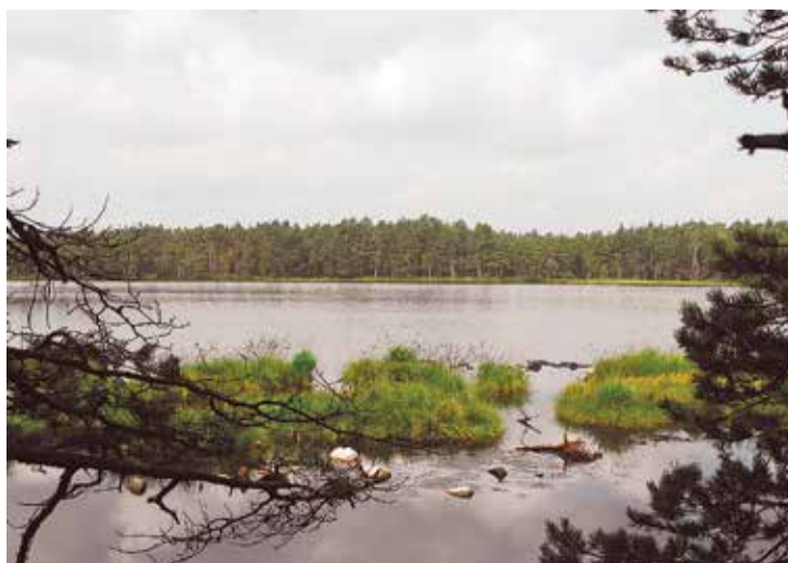
Ainaviskās upes un ezeri ir viena no pagasta vizītkartēm. Melnezers ir viens no skaistākajiem ne tikai pagastā, bet visā Limbažu novadā.