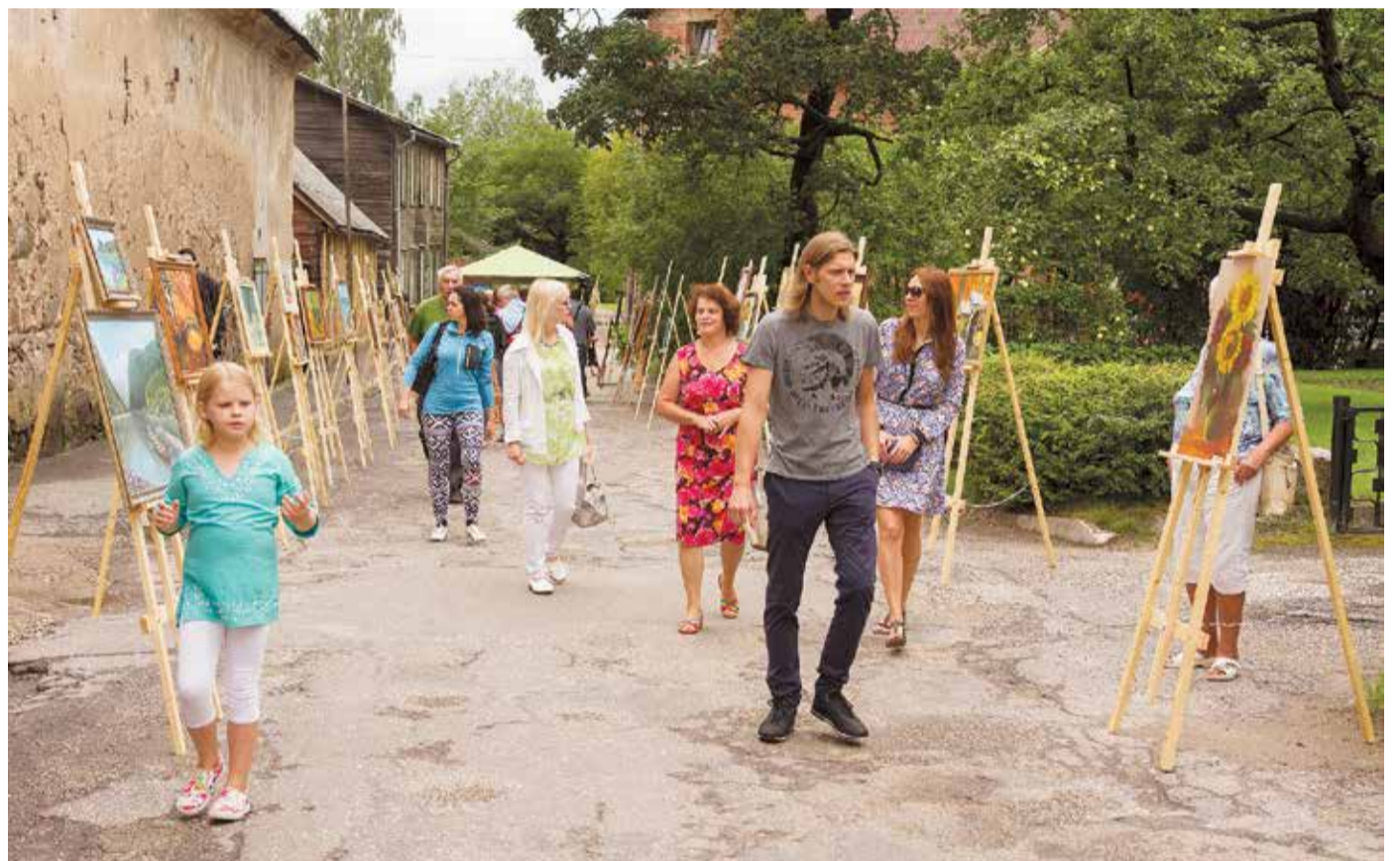
Attēlā: Dzirnava iela pārtapusi par Mākslas ielu.

Biedrība „Limbažu lauku sieviešu apvienība „Lemisele”” īstenoja projektu „Iespēja gleznot ikvienam!”. Projekta mērķis bija popularizēt gleznošanas iespējas, tā ietvaros tika izgatavoti izstāžu statīvi un Limbažu pilsētas svētkos sarīkota novadnieku gleznu izstāde, Dzirnava ielu pārveidojot par Mākslas ielu. Šim mērķim biedrība ieguva līdzfinansējumu 700 EUR apmērā.