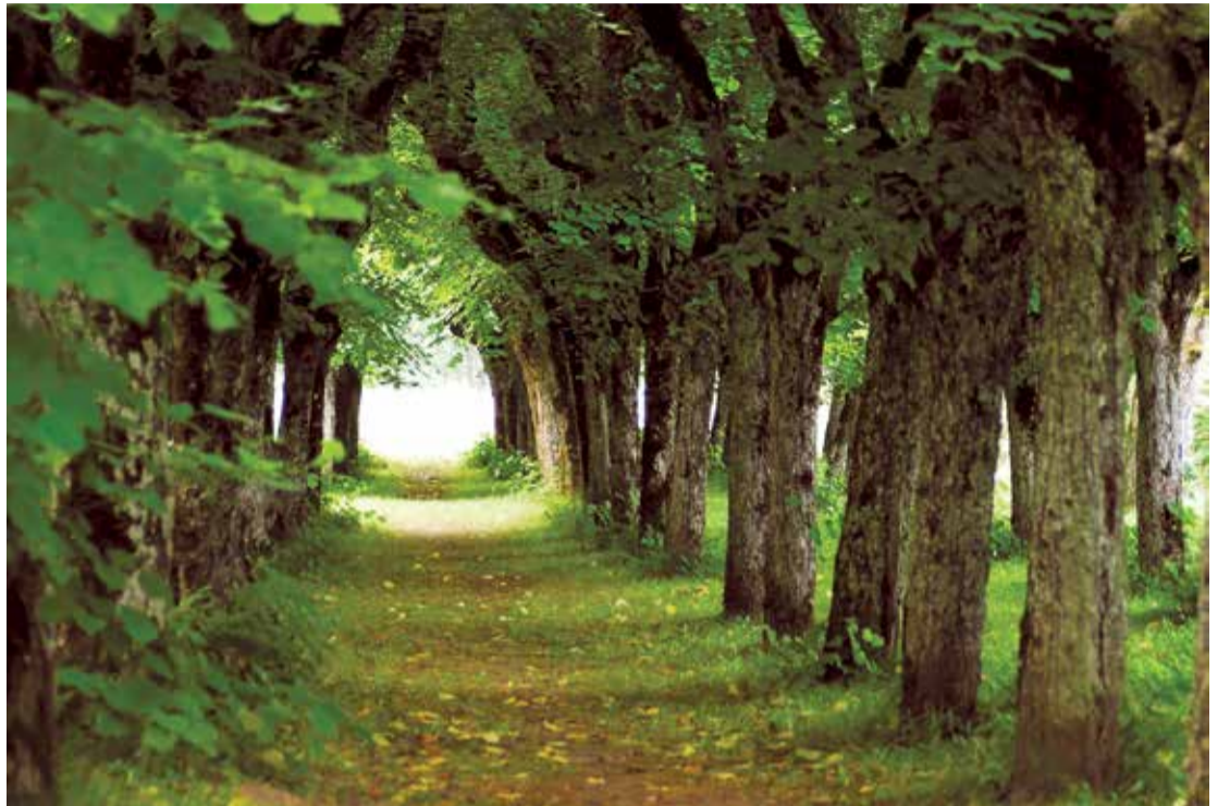
Katvaru ezermalas parks ir viena no gleznainākajām un pagasta iedzīvotāju un viesu iecienītākajām atpūtas vietām. Seno liepu alejas un liepu labirints vilina ne tikai ar dabas skaistumu, bet vienmēr raisa arī fantāziju. Stāsta, ka ar šejienes parku saistīti daudzi nostāsti un leģendas.