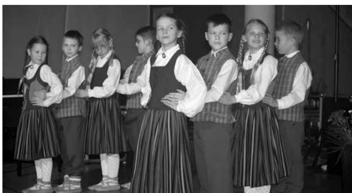
Vidrižu pamatskolas deju kolektīvs.

Katrs koncerta apmeklētājs varēja sajūst patriotisma garu, kā arī pārdomāt, ko katram pašam nozīmē māja – Latvija, Tēvzeme un mīlestība. Sprīdītis un Lienīte klausītājus aicināja izdzīvot Latvijas skaistākos mirkļus visos četros gadalaikos. Caur tiem ejot, mūs priecēja Vidrižu pirmsskolas un pamatskolas ansambļi, koris, deju kolektīvi, folkloras kopa “Delve”, senioru ansamblis “Savam priekam” un jauktais koris “Zvignza”. Visus klātesošos uzrunāja Limbažu novada Domes priekš-