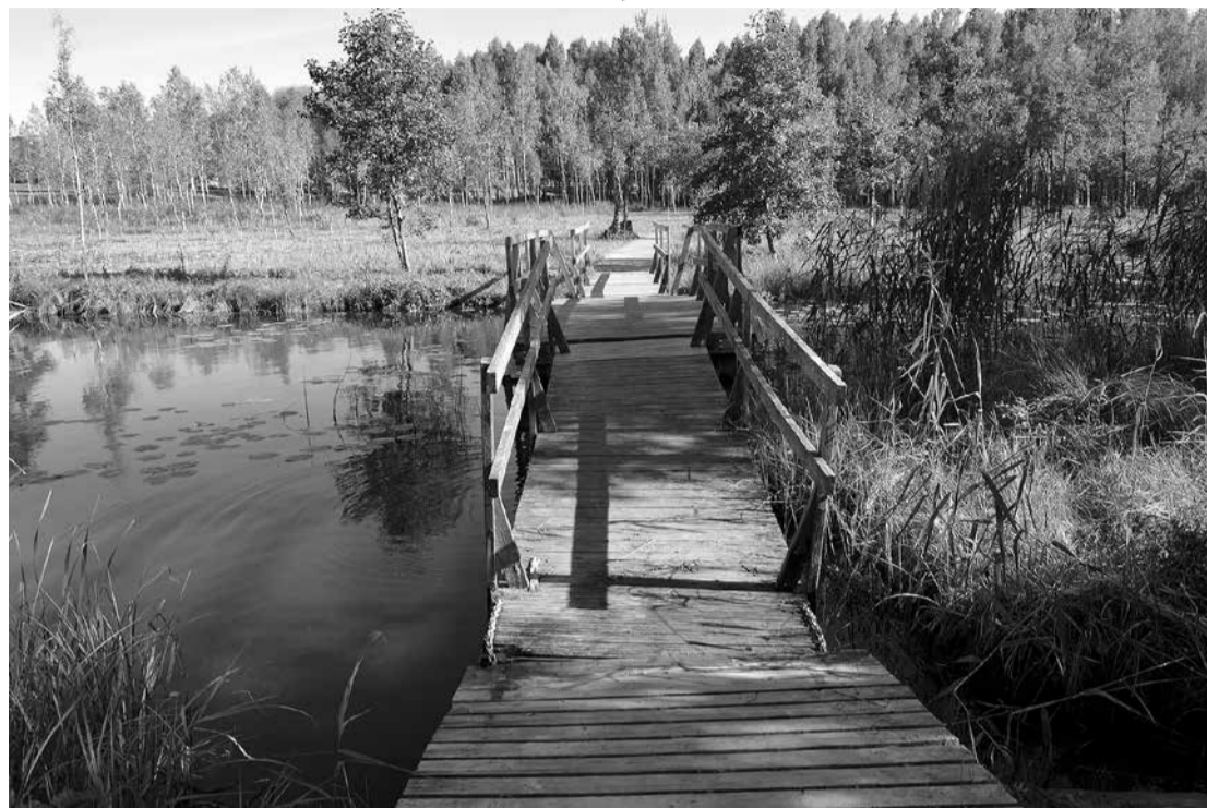
Tilts pirms pārbūves darbu veikšanas.

Limbažu novada pašvaldība ieguldīs finansējumu 67 263,63 EUR apmērā tilta uz Lielezera dabas takas pār Donaviņas upi pārbūvē. Dabas taka ir iemīļota pastaigu vieta gan limbažniekiem, gan pilsētas viesiem, diemžēl pašreizējais pontonu tilts ir sliktā stāvoklī, tā ponto-