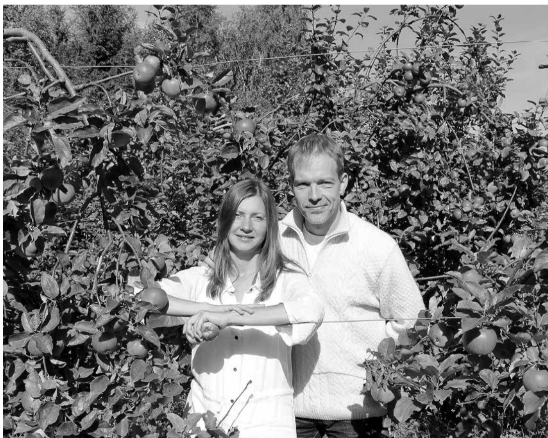
Ābols kā pirmsākums. Ābola aplis kā nebeidzamais stāsts. Ābols – sfēra, kā punkts visuma centrā, sākums ko izziņāt.

iespējas un resursus. Uzrunāja augļu pozitīvā enerģētika. Ābeļu miers, spēks. Tagad, kad koki jau lieli, dārzā strādājot to īpaši var izbaudīt. 18 gadus, kad sākām saimniekot, daudz nedomājām. Tai laikā jūra bija līdz ceļiem un iespējams likās pilnīgi viss. Sekojām savai sirds balsij un iecerētais vedās no rokas. Atbalsts