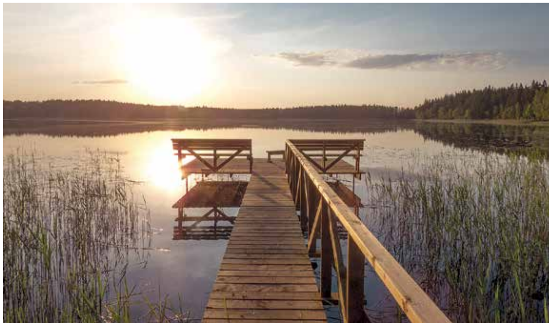
Katvaru ezers ir viena no Limbažu novada dabas pērlēm.