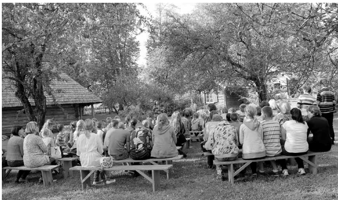
Dzejas dienu pasākumā muzejā „Rumbiņi” pulcējas ļoti daudzi dzejas cienītāji.

2018. gadā atzīmēsim muzeja 25 gadu un Friča Bārdas memoriālās istabas 50 gadu jubileju. Par godu šīm jubilejām tiks veidota izstāde par muzeja tapšanu. 2019. gadā atzīmēsim Friča Bārdas nāves 100. gadadienu. Ir iecere atjaunot vēsturisko lubu