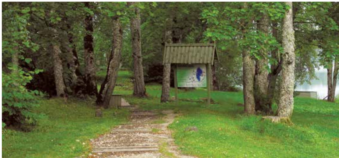
Katvaru ezers, nenoliedzami, ir viens no galvenajiem vietējo iedzīvotāju un pagasta viesu atpūtas objektiem. Tā gleznainie krasti un neatkārtojamais seno liepu parks piesaista daudzus.

Esam izveidojuši labiekārtotu pludmali, laivu un ūdensvelosipēdu nomu. Īpaši iecienīta tā ir vasarās, kad ezers ir pievilcīgs peldēt un atpūsties gribētājiem. Ezerā nu jau otro gadu notiek ALDA kausa izcīņas rudens posms