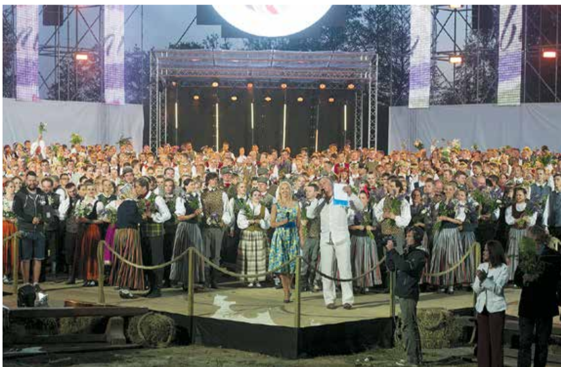
Foto mirkli no Deju lieluzveduma “Jel dod man bučiņ!”.