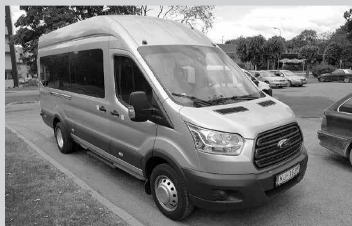
Autobuss FORD TRANSIT Limbažu pagasta skolēnu pārvadāšanai.

Limbažu novada pašvaldība iegādājusies trīs transportlīdzekļus – autobusu FORD TRANSIT ar 18 sēdvietām, mazlietotu apvidus automašīnu NISSAN NAVARA un mazlietotu vieglo pasažieru automašīnu VW CADDY MAXI. Autobuss FORD TRANSIT iegādāts Limbažu pagasta skolēnu pārvadāšanai, tā iegādes izmaksas ir 44 394,90 EUR. Mazlietota apvidus automašīna NISSAN NAVARA par 17 908,00 EUR iegādāta pašvaldības aģentūrai "ALDA" – laivu u.c. tehnikas pārva-