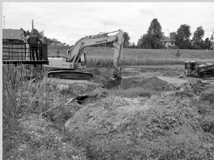
Starp Mazezeru un SIA "Limbažu siers" tika ievietota caurule ūdens tālākai novadīšanai uz Dūņezeri.

Aizvadītā gada nogalē Limbažos tika uzsākta dzirnavu Mazezera nosusināšana, nolaižot ūdeni un Mazezerā esošās zivis pārvietojot uz Dūņezeri. Jūnijā, turpinot nosusināšanas darbus, starp Mazezeru un SIA "Limbažu siers" tika izbūvēta caurule, bet Mazezerā, lai papildus veicinātu nosusināšanos, tiks izrakti kanāli pa kuriem ezerā atlikušais ūdens tālāk tiks novadīts uz Dūņezeri.