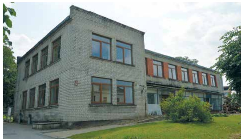
Ēka Jūras ielā 27 pirms pārbūves.

ras ielā 27 pārbūvē ieguldīs līdzekļus 573 474,72 eiro apmērā, šim mērķim Valsts kasē ņemot ilgtermiņa kredītu.