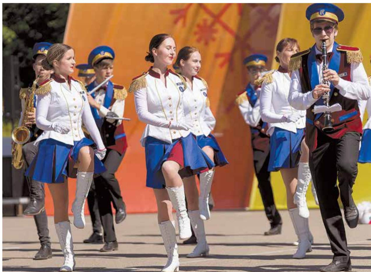
Foto mirkļi no Bērnu deju kolektīvu koncerta "Rakstu raksti".