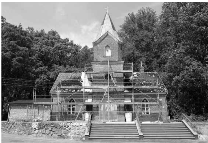
Limbažu kapu kapličas ēka.

Limbažu kapu kapličas ēkai, Jūras ielā 56 tiek veikts jumta konstrukciju remonts, jumta seguma nomaiņa, kā arī atjaunots logu un durvju krāsojums. Šo darbu veikšanā pašvaldība iegulda līdzekļus EUR 10 890 apmērā, remontdarbus veic SIA "ACCENT BŪVE". 2015.gadā pārbūves un labiekārtošanas darbu ietvaros Limbažu kaplicai jau tika pārbūvētas galvenās kāpnes, atjaunots bruģakmens laukums ap kapličas ēku, atjaunota lietus ūdens novadīšanas sistēma un atjaunoti soliņi. Kopējās pārbūves un lab-