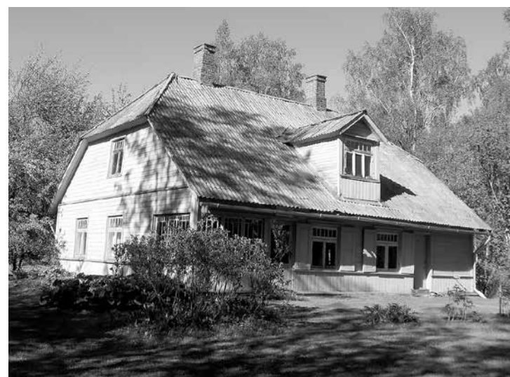
Fricā Bārdas celtā māja „Dārziņi”

Bārdu dzimtas memoriālā muzeja „Rumbiņi” vadītāja