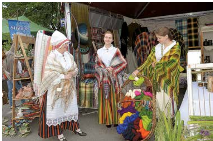
► Turpinājums no 1. lpp.

Četras dienas Vīlandē mutuļoja Hanzas dienu tirgus un dažādi kultūras pasākumi. Vienu pilsētas kvartālu ieskāva Hanzas pilsētu stendi, kuros tika prezentēti tām raksturīgie produkti, amatnieku darinājumi, tūrisma pakalpojumu piedāvājums, neaizmirstot par saistību ar Hanzas savienību. 35. Hanzas dienās bija pārstāvētas 75 pilsētas no 15 valstīm. Teju visas vecpilsētas ieliņas bija piepildītas ar dažādu valstu amatnieku un mājažotāju stendiem.