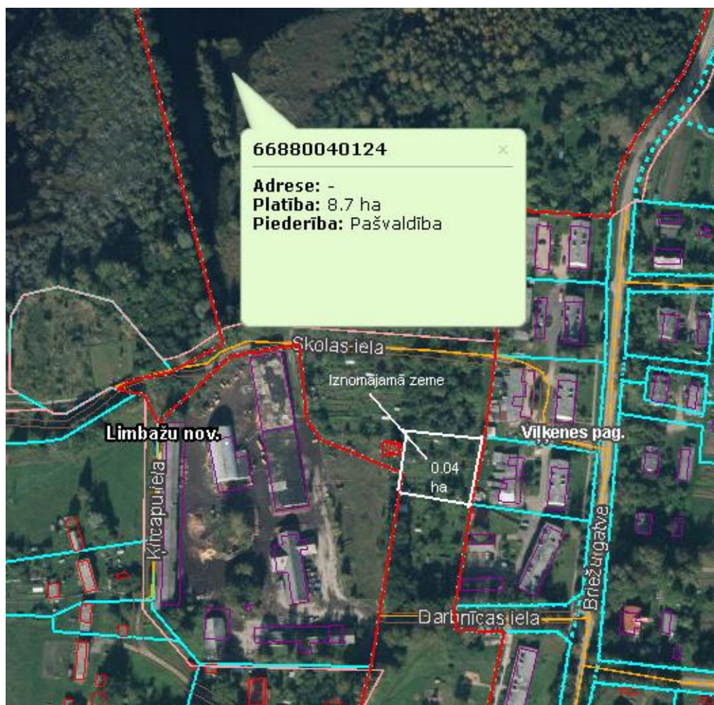
Iznomājamās zemes vienības daļa