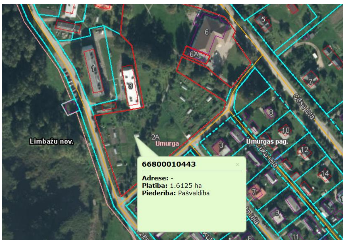
Iznomājamā zemes vienības daļa