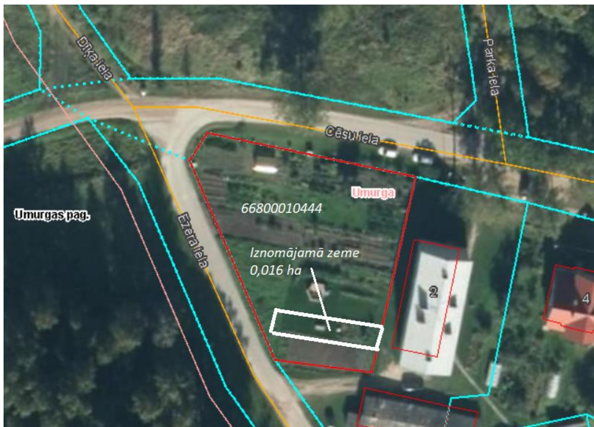
Iznomājamā zemes vienības daļa